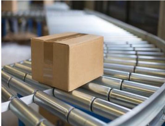
Versandpaket eines Online-Händlers